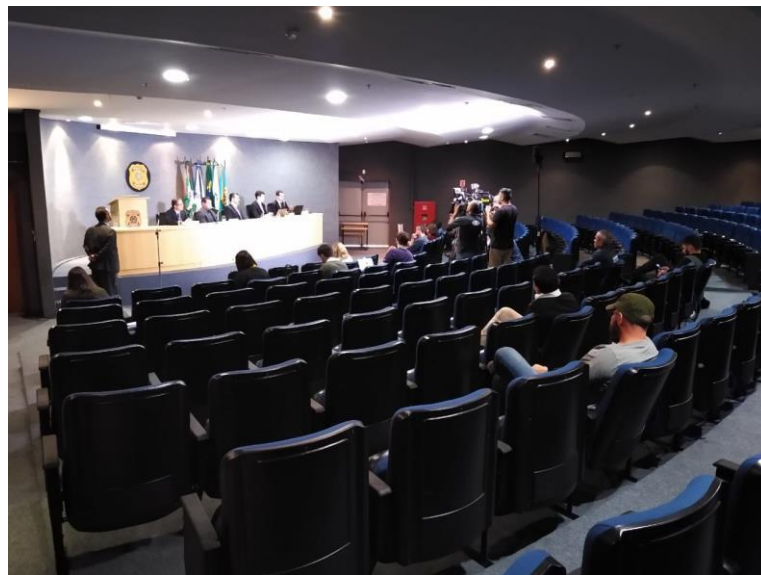
Fotografia 3 - Foto da realização da 61ª Fase da Operação Lava Jato.