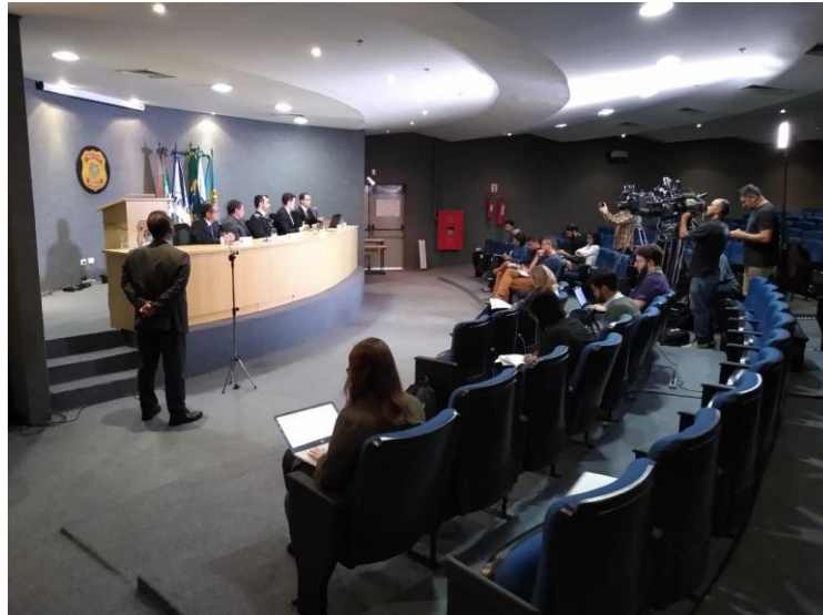
Fotografia 1 - Foto da realização da 61ª Fase da Operação Lava Jato.

Enquanto a coletiva se desenvolvia, realizei três fotos para ajudar a compreender o ambiente onde as entrevistas aconteciam: