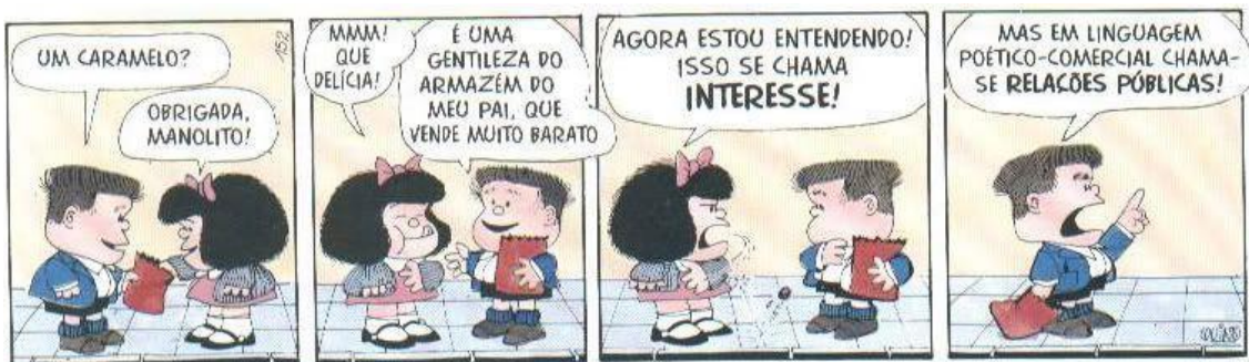
Figura 3 - Charge Mafalda e Manolito