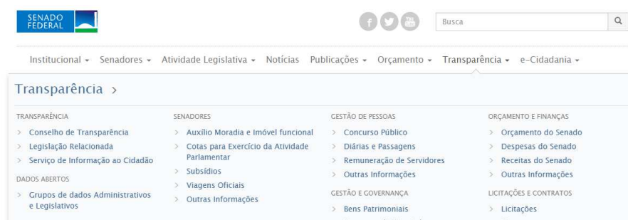
Figura 2 - Aba de transparência do Senado Federal

229