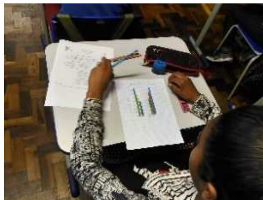
Figura (5): Construção dos gráficos