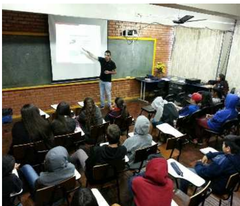
Figura (4): Tipos de gráfico

e pedimos aos alunos para que calculassem o resultado de cada uma das disputas. Todas as etapas do projeto foram acompanhadas pelos alunos bolsistas do Pibid.