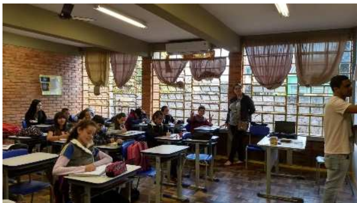
Figura (6): Análise dos dados e cálculos em aula