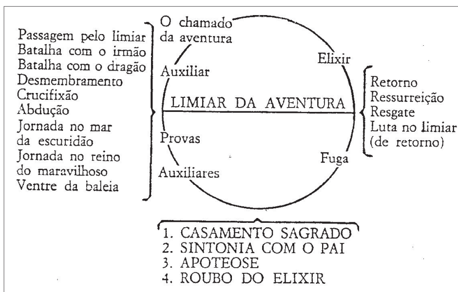
Figura 1: A Jornada do Herói por Joseph Campbell

No último bloco de fases, o monomito passa pelas seguintes etapas, conforme figura 1: 12) A recusa do retorno: o herói deve voltar para o mundo comum e transmitir o conhecimento adquirido a seus pares;13) A fuga mágica: é possível que o herói precise de ajuda para voltar ao mundo comum;14) O resgate com auxílio externo: outro personagem da narrativa pode auxiliar no retorno do herói;15) Passagem pelo limiar de retorno: ocorre a passagem do reino mágico para o mundo cotidiano;16) Senhor de dois mundos: a consciência ampliada no herói traz benefícios ao mundo comum;17) Liberdade para viver: renascido, o herói reconhece sua própria trajetória e está aberto à novas experiências. (CAMPBELL, 2007).