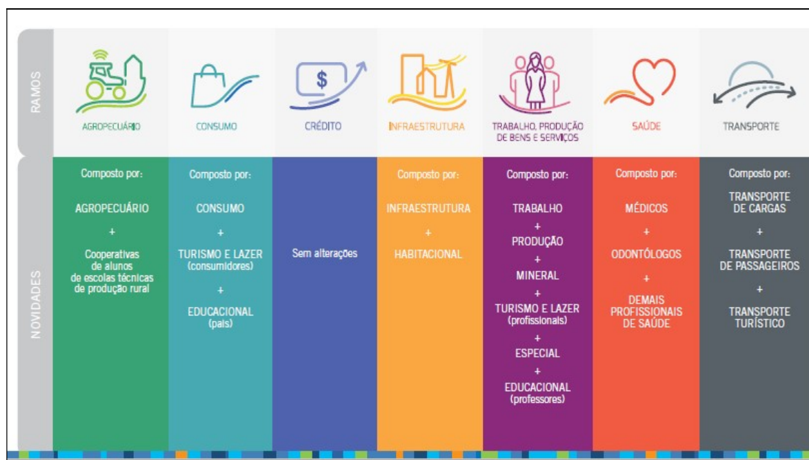
Figura 2 – Ramos do Cooperativismo