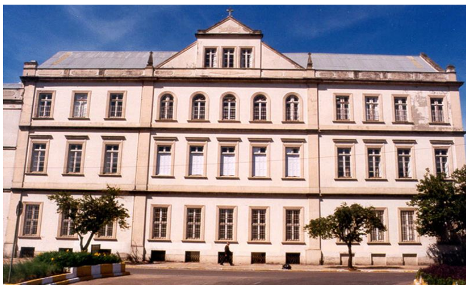
Fotografia 1 - Antiga sede da Unisinos