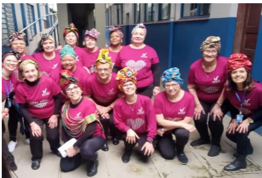
Fotografia 6 - Registro antes da apresentação