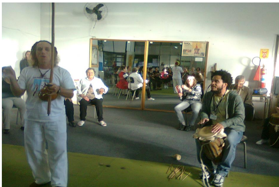
Fotografia 3 - Compartilhamento de instrumentos da cultura afro-brasileira