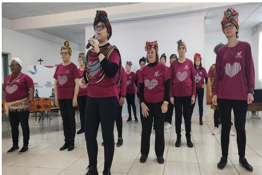
Fotografia 8 - Evento Redão