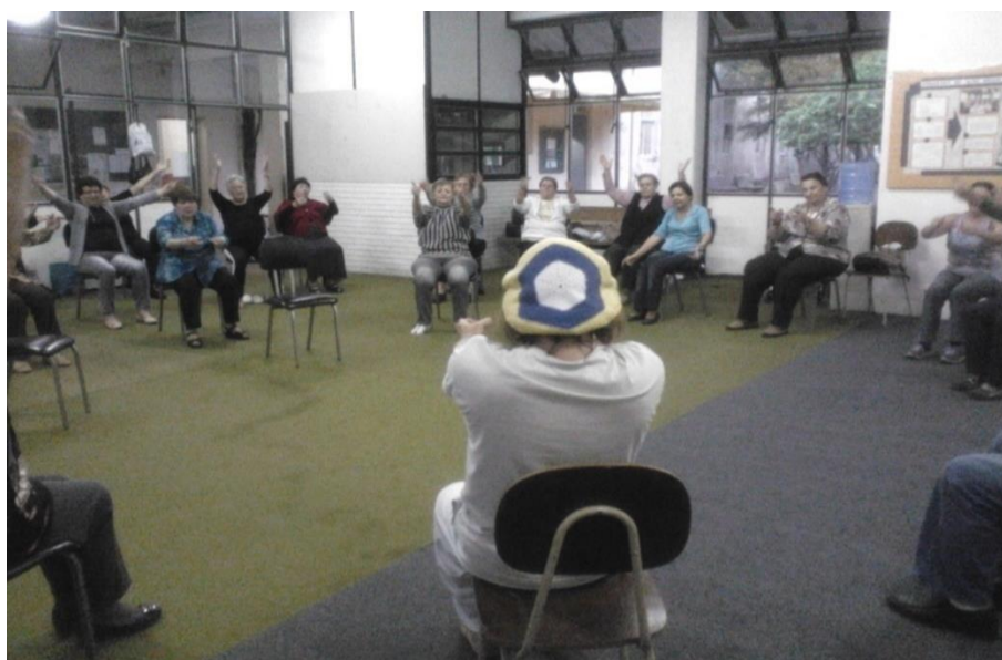
Fotografia 2 - Aula de capoeira