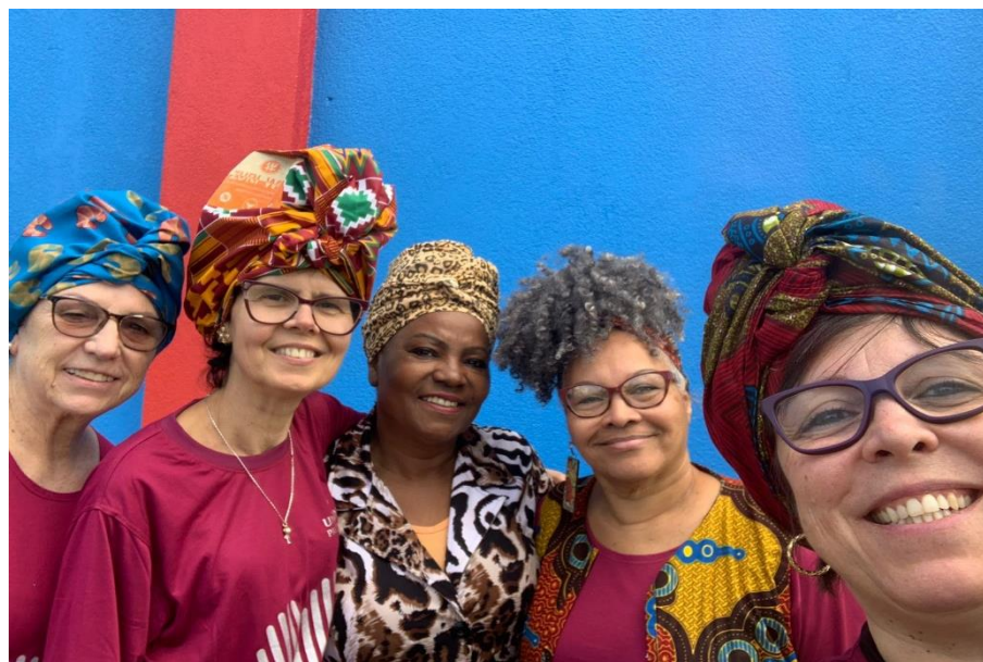
Fotografia 9 - Registro após a apresentação