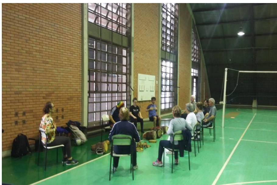
Fotografia 4 - Atividade no complexo desportivo da Unisinos