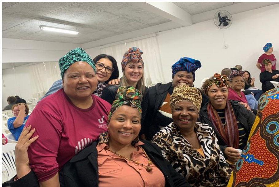
Fotografia 7 - Momento de colocação do turbante