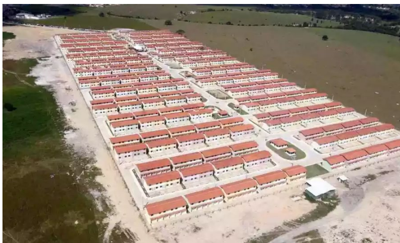
Figura 02 – Minha Casa Minha Vida em Eunápoli (BA)