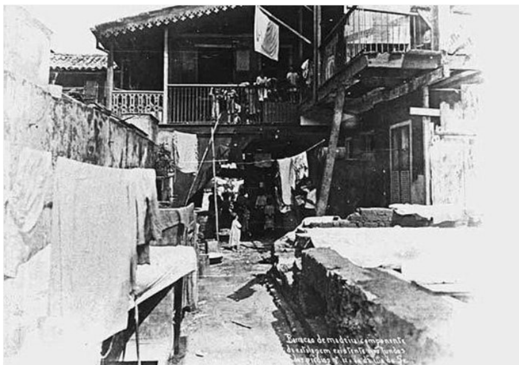
Figura 01 – Os cortiços do centro do Rio de Janeiro do século XIX

Fonte: Augusto Malta - Biblioteca Nacional (1906)