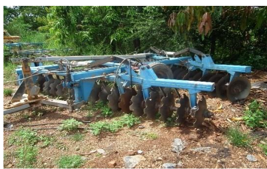
Fotografia 2 - Grade aradora capim e cana