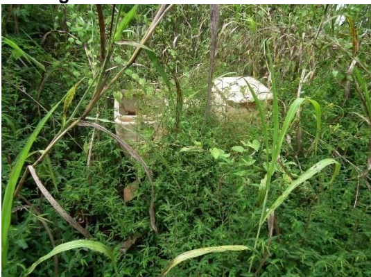
Fotografia 3 - Plantadeira Escondida