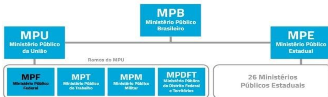
Figura 3 - Organograma de constituição do Ministério Público brasileiro

O Ministério Público brasileiro é composto pelos Ministérios Públicos Estaduais, que tem atuação nos Estados e pelo Ministério Público da União que tem uma atuação maior, compreendendo: o Ministério Público Federal, o Ministério Público do Trabalho, o Ministério Público Militar e o Ministério Público do Distrito Federal e Territórios.