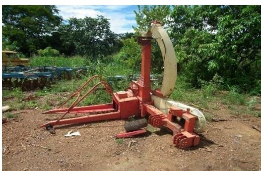
Fotografia 1 - Ensiladeira e picadeira