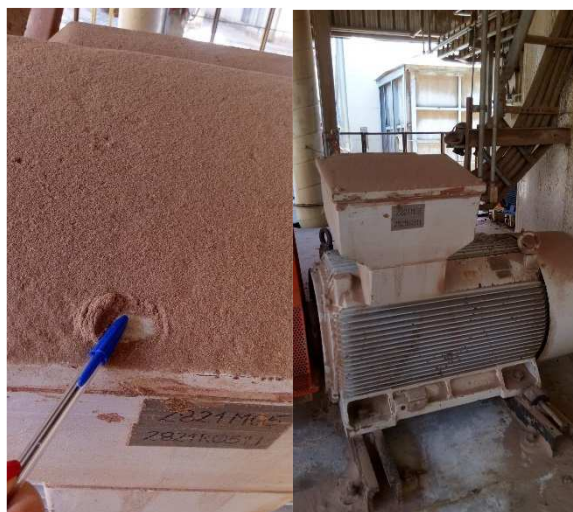
Fotografia 3 – Motor empoeirado

No local visitado encontram-se equipamentos elétricos como painéis, motores e sensores. Muitos desses motores apresentam uma camada significativa de pó em cima conforme ilustrado nas fotografias a seguir.