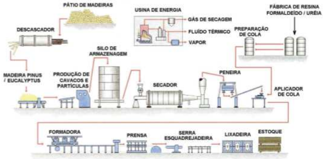
Figura 1 – Processo Produtivo de Painéis de Madeira