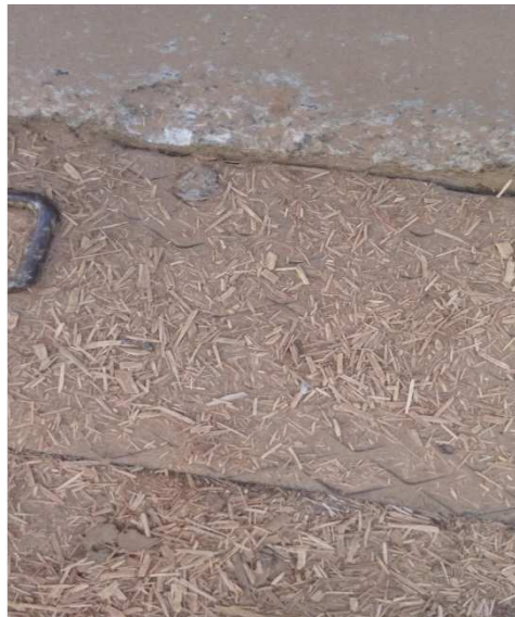
Fotografia 1 – Material da área externa do moinho

Posteriormente, foi avaliada a área externa do moinho, percebeu-se o acúmulo de material ao redor conforme apresenta a Fotografia 1.