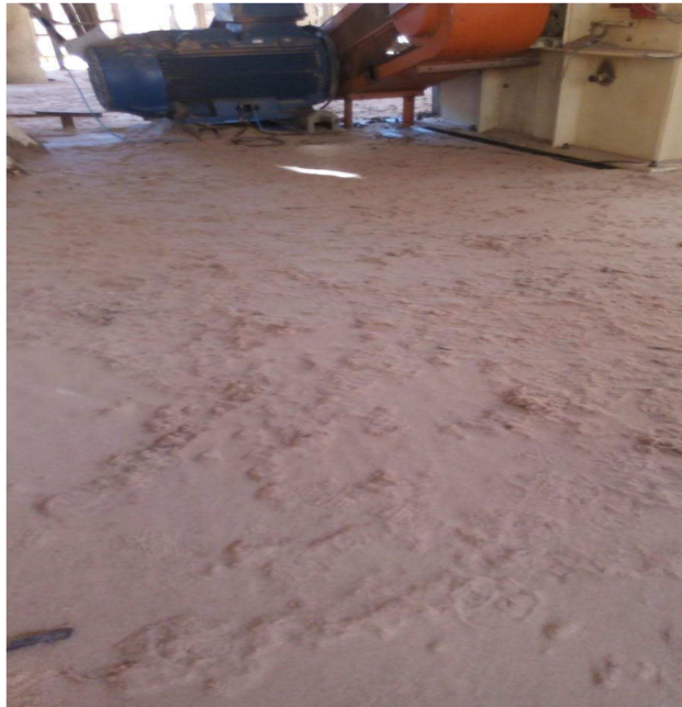
Fotografia 2 – Concentração de poeira