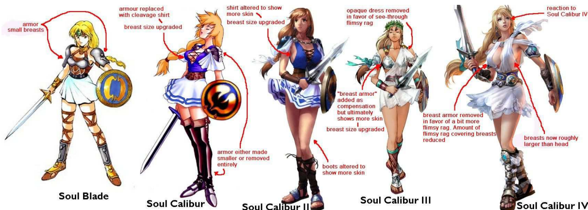
Figura 7: Sophitia: personagem do game de luta “Soul Calibur” 20 .

Outra questão a ser avaliada neste estudo é a influência do consumo de jogos digitais na cultura gamer. Toma-se por verdade que, segundo o estudo de Lívia Barbosa (2010), que o consumo estaria se tornando o principal foco da sociedade contemporânea, que o utiliza não apenas para suprir suas necessidades básicas, mas para saciar vontades pessoais. Vontades essas que, segundo a autora, estariam diretamente ligadas com valores sociais, ou seja, valores estabelecidos por intermédio de vínculos com outras pessoas a fim de criar laços e relações com estas.