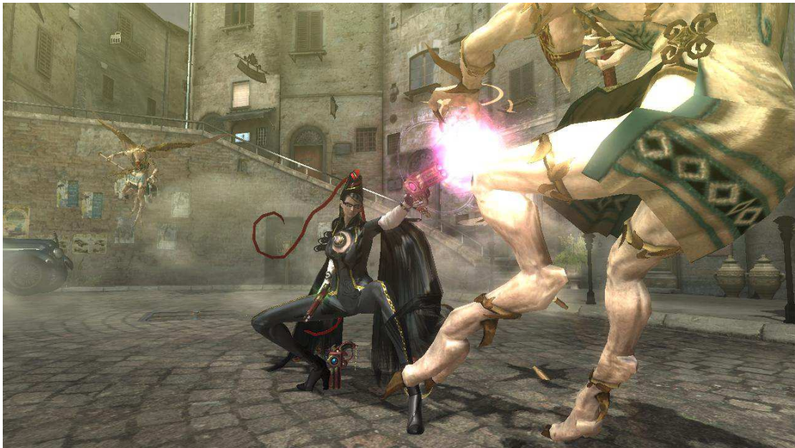
Figura 15- A protagonista usa armas de fogo e faz poses insinuantes.