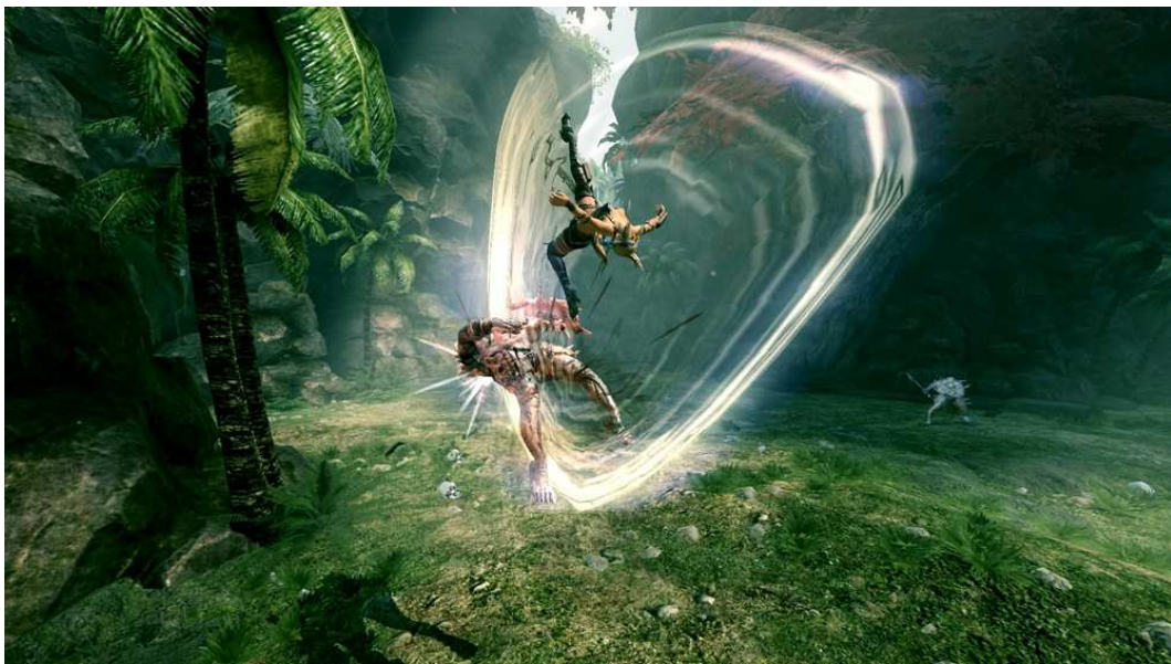
Figura 27- Habilidades não- humanas