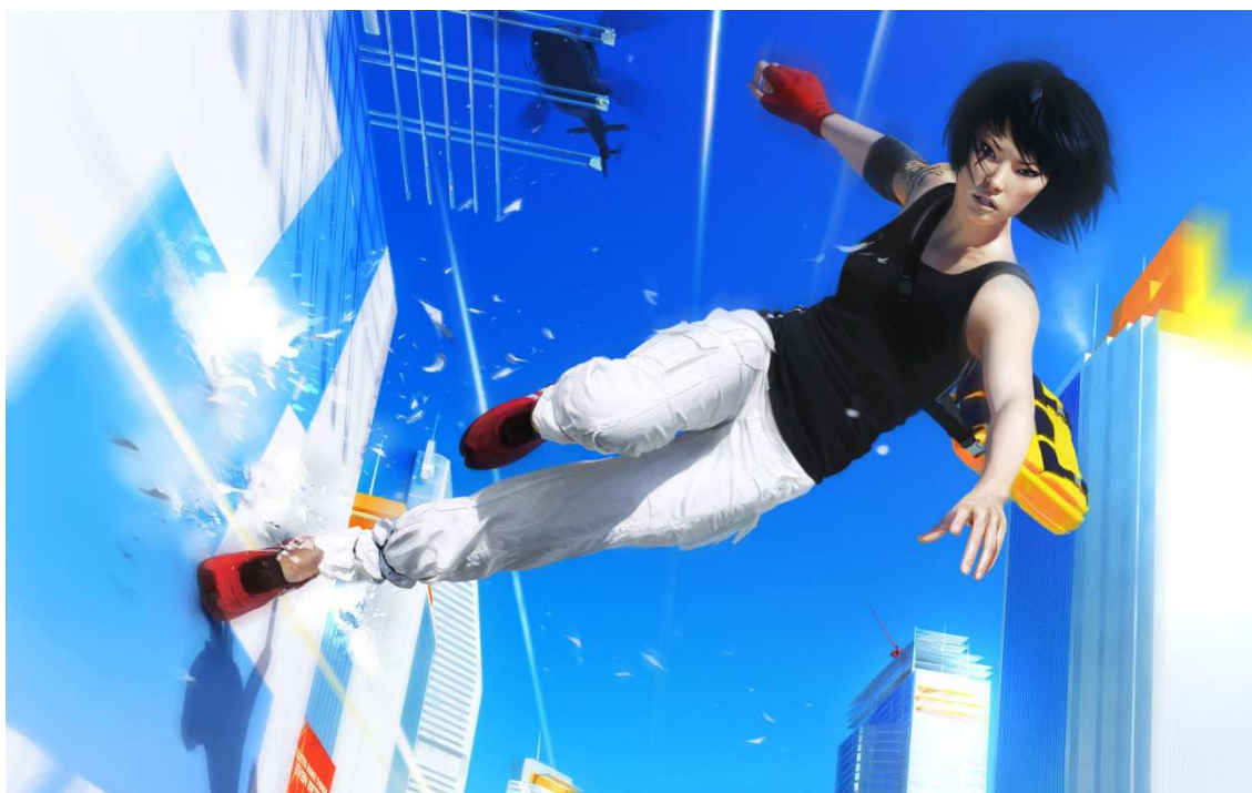
Figura 11- Imagem promocional mostrando a protagonista Faith deslizando pelos edifícios.

O cenário do game é atual, envolvendo prédios, encanamentos, tubulações, grades, carros e outros elementos encontrados atualmente, focando principalmente naqueles que a personagem pode interagir. O game não teve muita repercussão no mundo dos jogos, uma vez que pouco se ouve falar dele e aparecem algumas queixas quanto a erros de funcionamento.