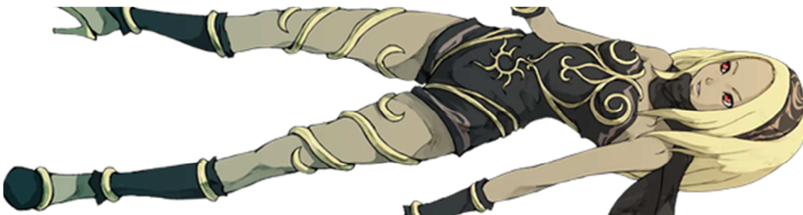
Figura 36- Kat, do game Gravity Rush