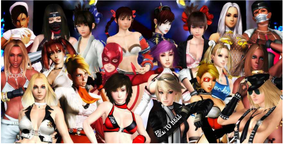
Figura 31- Personagens do game Rumble Roses