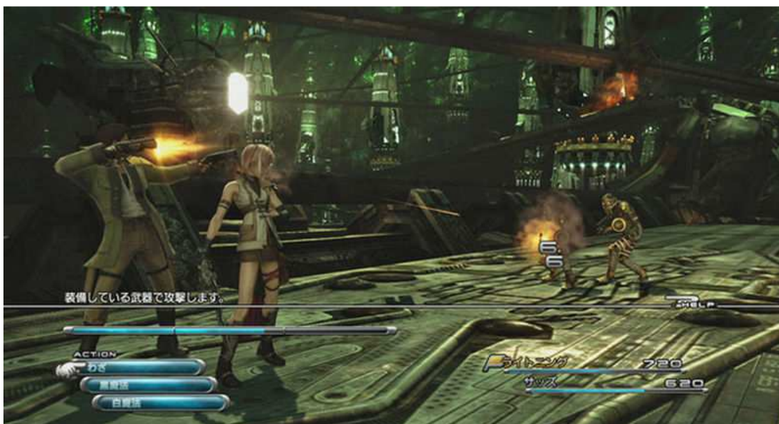
Figura 22- Gameplay do jogo.