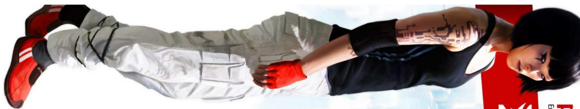
Figura 37- Faith, do game Mirror's Edge