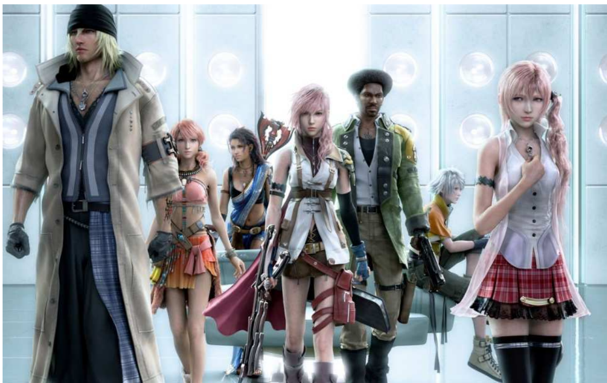
Figura 20- A protagonista (centro) e os demais personagens jogáveis do game.

cuja missão principal ,que acredita ser proteger a irmã mais nova, desenvolve um lado arrogante e independente, ao mesmo tempo em que parece se preocupar e manter um sentimento muito forte. Com o desenvolver da história, ela e os outros personagens percebem que precisam salvar todo o mundo em que vivem.