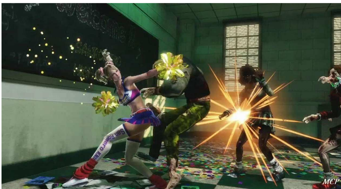
Figura 25- Gameplay: Mistura das cores vivas da roupa da personagem com as cores escuras dos inimigos.