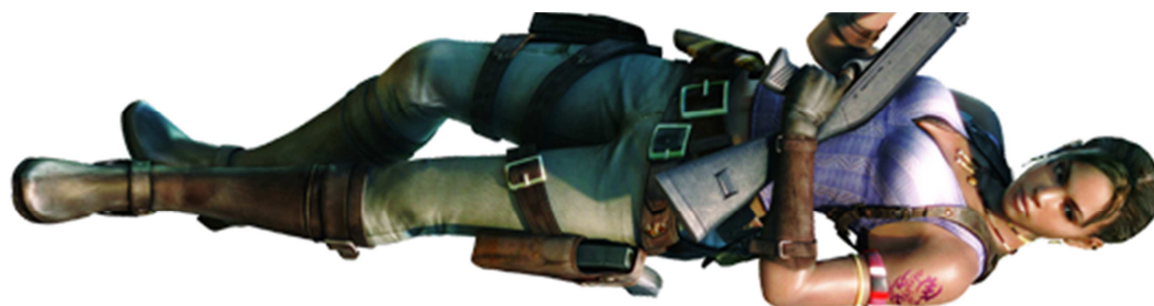
Figura 41- Sheva, do game Resident Evil 5