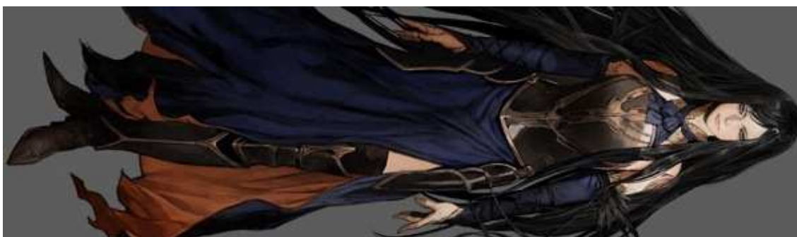
Figura 35- Shanoa, do game Castlevania Order of Ecclesia