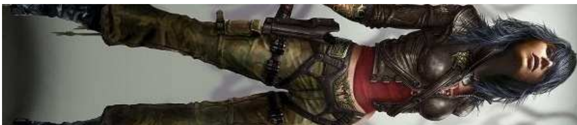
Figura 40- Rubi Malone, do game Wet