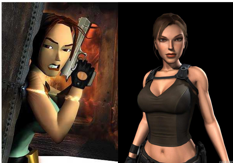
Figuras 5 e 6: Lara Croft em dois jogos diferentes da saga: Tomb Raider I: Atlantean Scion (1996) e Tomb Raider Legend (2006).

No século XXI, percebe-se que o número de personagens e protagonistas femininos aumenta. Aumenta também o trabalho em cima das características pessoais das personagens e sua autonomia perante a figura masculina. Dentre alguns jogos de destaque, podemos citar Heavenly Sword (2007, Ninja Theory), Bayonetta (2009, sega) e Final Fantasy XIII (2009, squareenix).