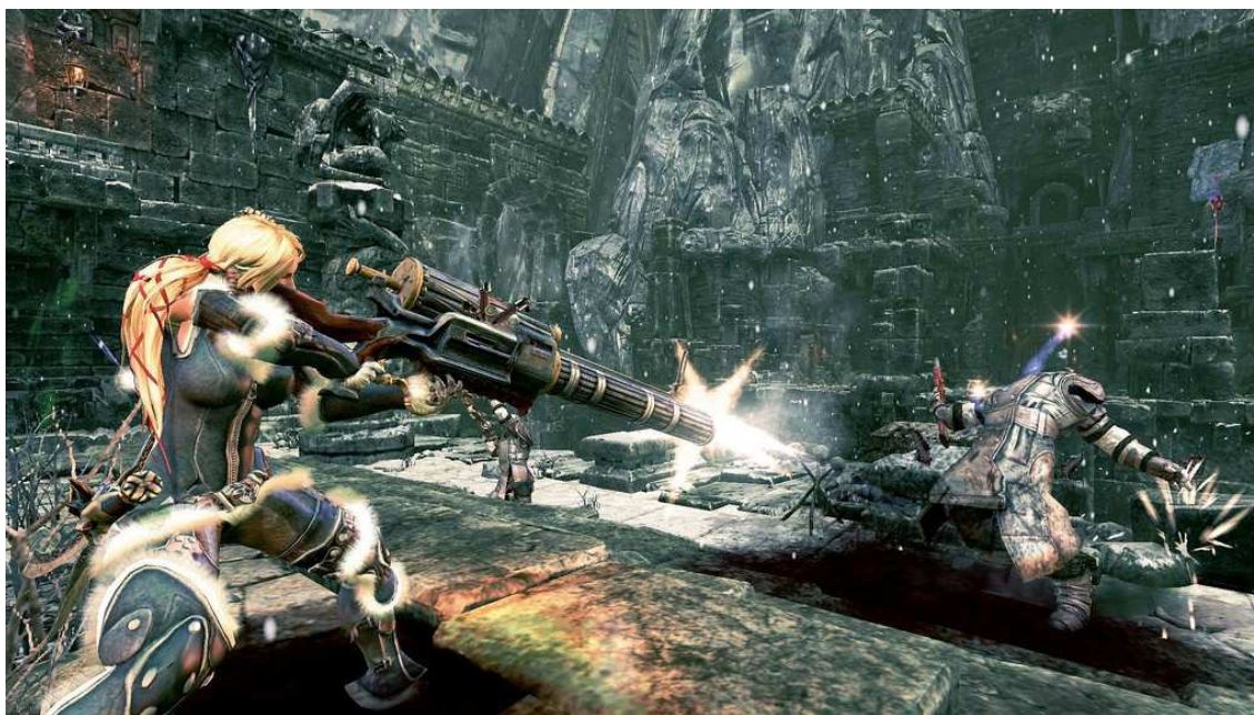
Figura 28- Novamente a protagonista portando uma arma de difícil manuseio para um humano normal.

Analisando essas personagens diante das especificações mostradas anteriormente, percebe-se algumas semelhanças bastante evidentes com as representações anteriores da mulher na mídia, tanto na questão visual quanto comportamental destas personagens. Se comparadas com as personagens dos quadrinhos do trabalho de Nádia Senna (1999), a mulher continua com seus traços de feminilidade, mas agora aparece com características da mulher do século XXI, mais forte, – inclusive, mais forte do que a estrutura corporal humana permite – assumindo papéis principais e de independência, não necessitando sequer da presença da figura masculina na narrativa destes games.