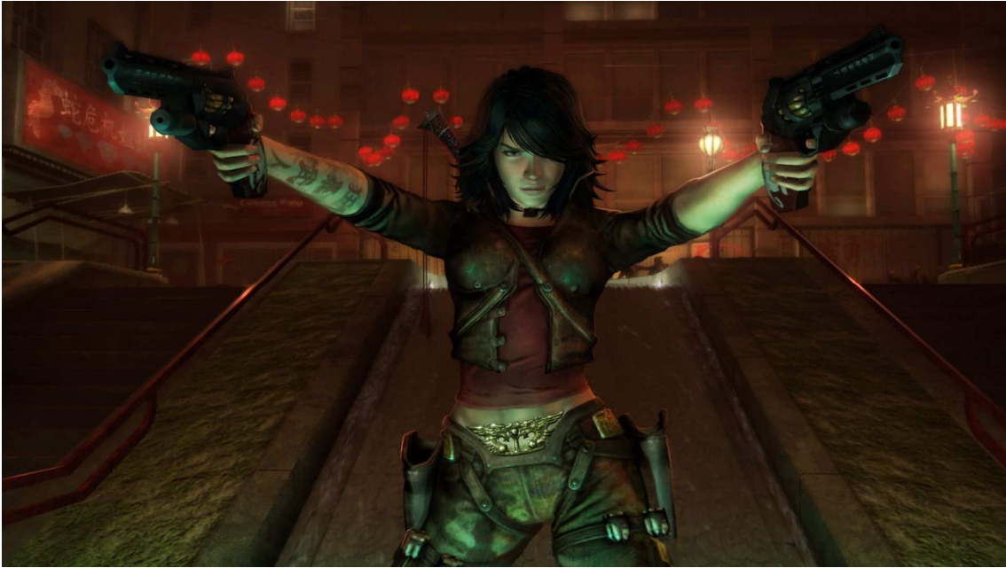
Figura 17- Cutscene mostrando as habilidades da protagonista.