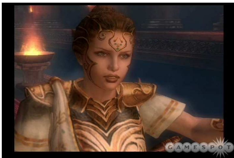
Figura 1: Athena, deusa da guerra na mitologia grega e no game God of War.

Exemplificando, temos um dos jogos de maior repercussão no mercado mundial, o God of War (Santa Mônica, 2001). O jogo, baseado na mitologia grega, tem como protagonista um homem chamado Kratos. As mulheres no game aparecem em dois momentos: como prostitutas, mulheres vulgares sem maiores importâncias na narrativa do jogo e como deusas e mães, que estão ali representando a família e a proteção.