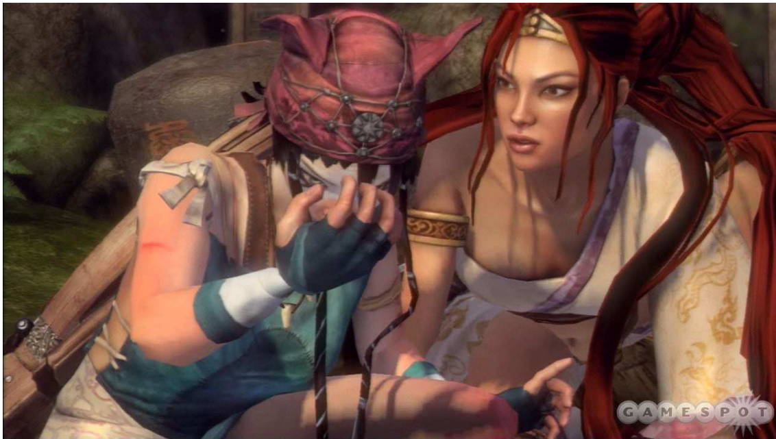
Figura 8- Nariko e sua irmã mais nova, Kai, em uma cena do game.

Sentimentos de raiva, culpa, desejo de vingança e o compromisso de proteger as pessoas que ama são situações que aparecem frequentemente na narrativa, demonstrando uma personagem de personalidade forte, mas com sentimentos muito puros e sinceros em relação aos seus familiares e amigos.