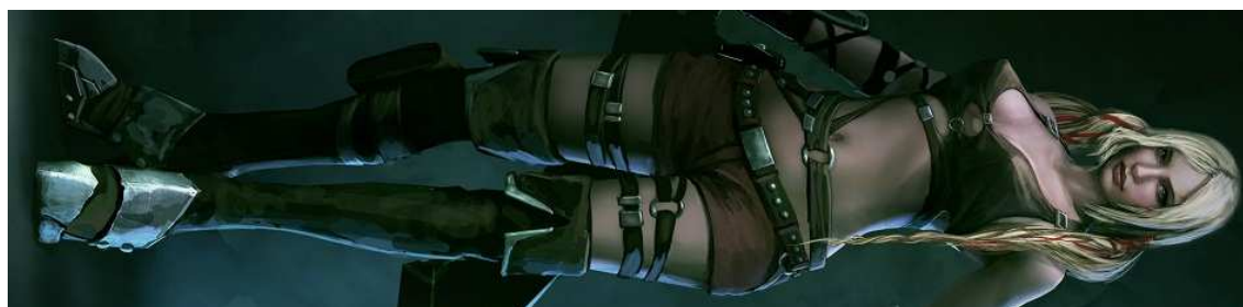
Figura 45- Ayumi, do game Blades of Time