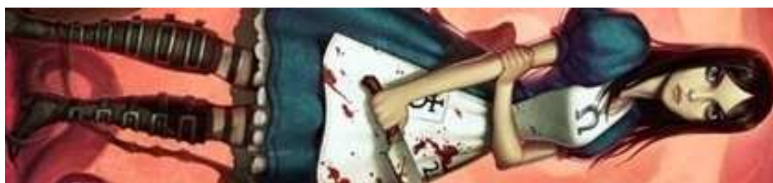
Figura 43- Alice, do game Alice Madness Returns