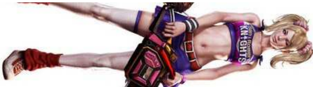
Figura 44- Juliet, do game Lollipop Chainsaw