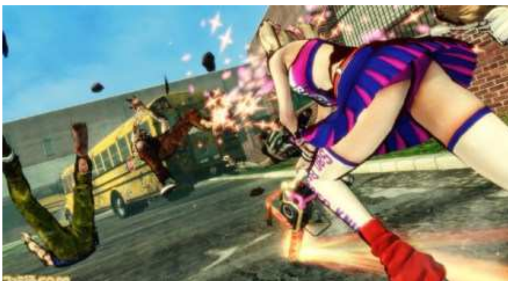
Figura 24- As cenas do game frequentemente mostram a protagonista por ângulos ousados.