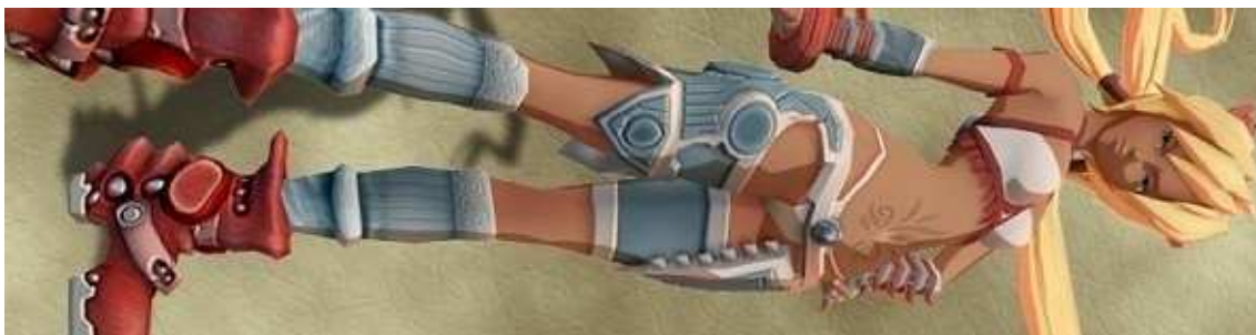
Figura 39- Ayumi, do game X-Blades