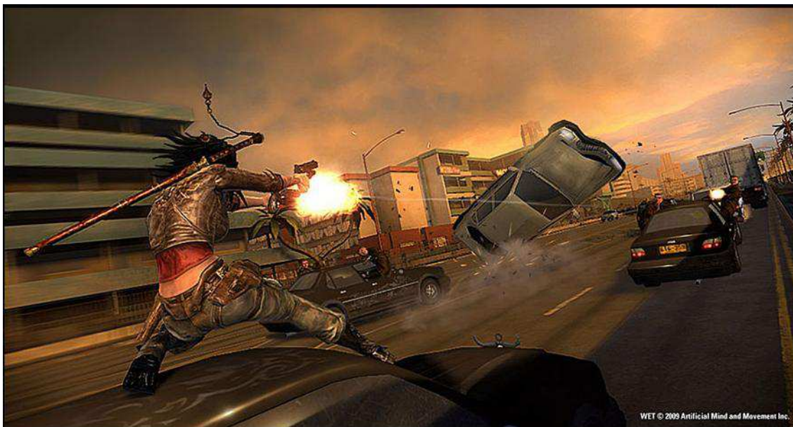
Figura 19- A personagem desafiando a gravidade, saltando sobre carros.