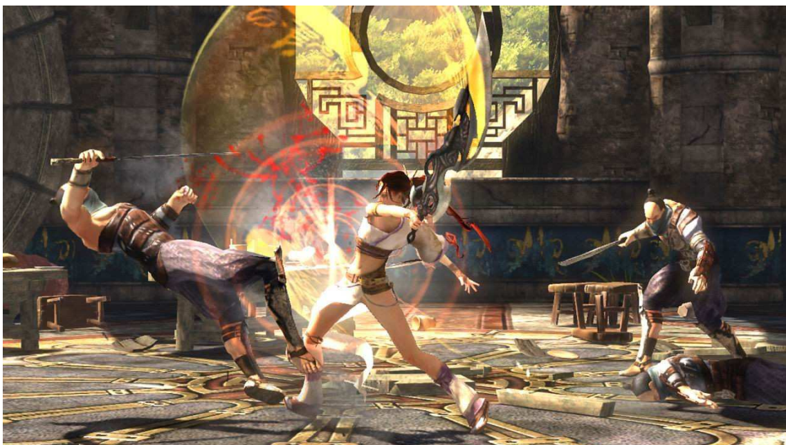
Figura 10- Nariko utilizando a Heavenly Sword para atacar os inimigos com golpes de curto alcance.