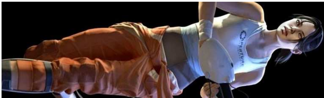
Figura 34- Chell, do game Portal