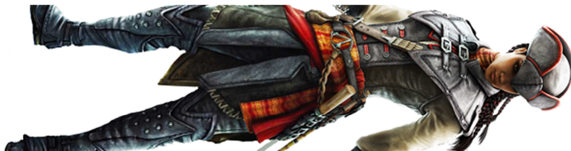
Figura 47- Aveline, do game Assassin's Creed III: Liberation