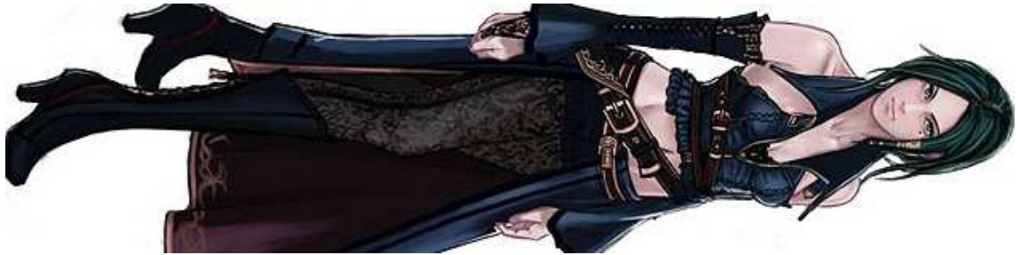
Figura 32- Alicia Claus, do game Bullet Witch