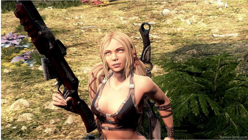
Figura 26- Foco na protagonista segurando uma arma de fogo que dificilmente uma mulher agüentaria segurar com apenas uma mão.