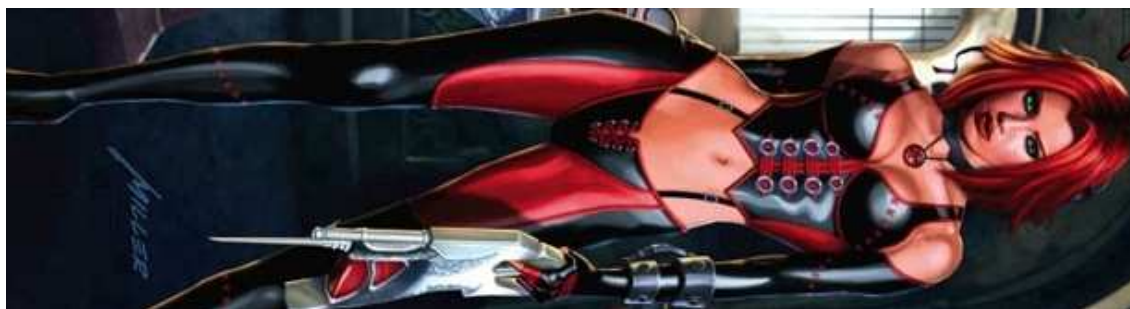
Figura 29- Rayne, do game Bloodrayne