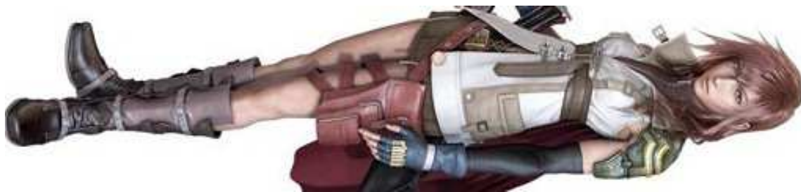
Figura 42- Lightning, do game Final Fantasy XIII