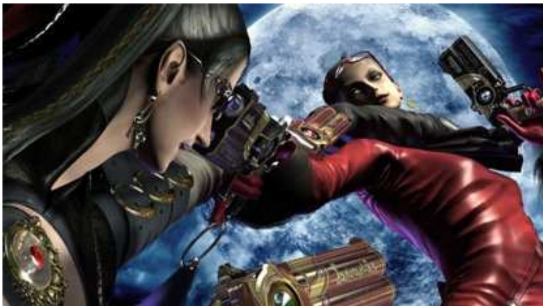
Figura 14- Bayonetta e Jeane, sua colega e rival.

Quanto à figura de Bayoneta, temos uma personagem extremamente sensual, utilizando roupas de couro coladas no corpo que potencializam suas curvas. Durante as batalhas, a protagonista fica nua e nota-se que sua roupa na verdade é feita com o próprio cabelo. O jogo atribui à personagem extrema sensualidade e elementos de apelo sexual que a caracterizam.