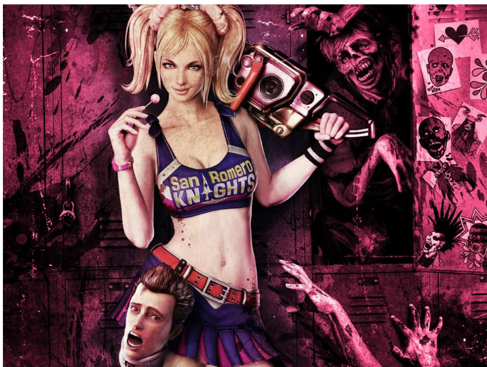
Figura 23- Imagem promocional da protagonista com seu “namorado”.

Apesar deste tom humorístico, o jogo conta com momentos em que a personagem demonstra muitos sentimentos por seu namorado e seus familiares. A missão torna-se mais séria quando ela precisa salvar suas irmãs e seu pai dos monstros que os sequestram e carregar consigo a cabeça do seu namorado ( por um ritual ela o mantém vivo) , demonstrando o tempo todo seu sentimento de amor por ele.