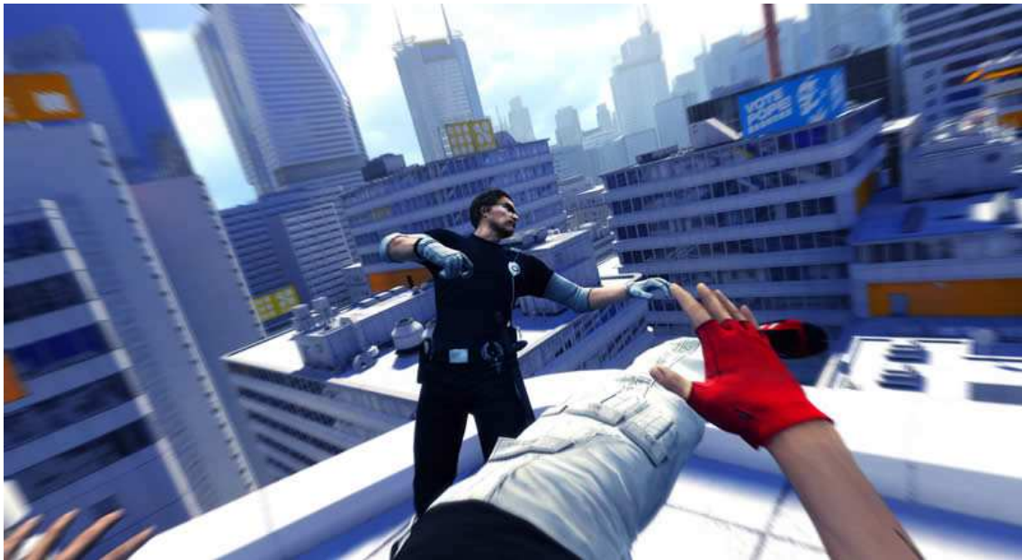
Figura 12- Visão em primeira pessoa do game. Cena de combate do próprio jogo.