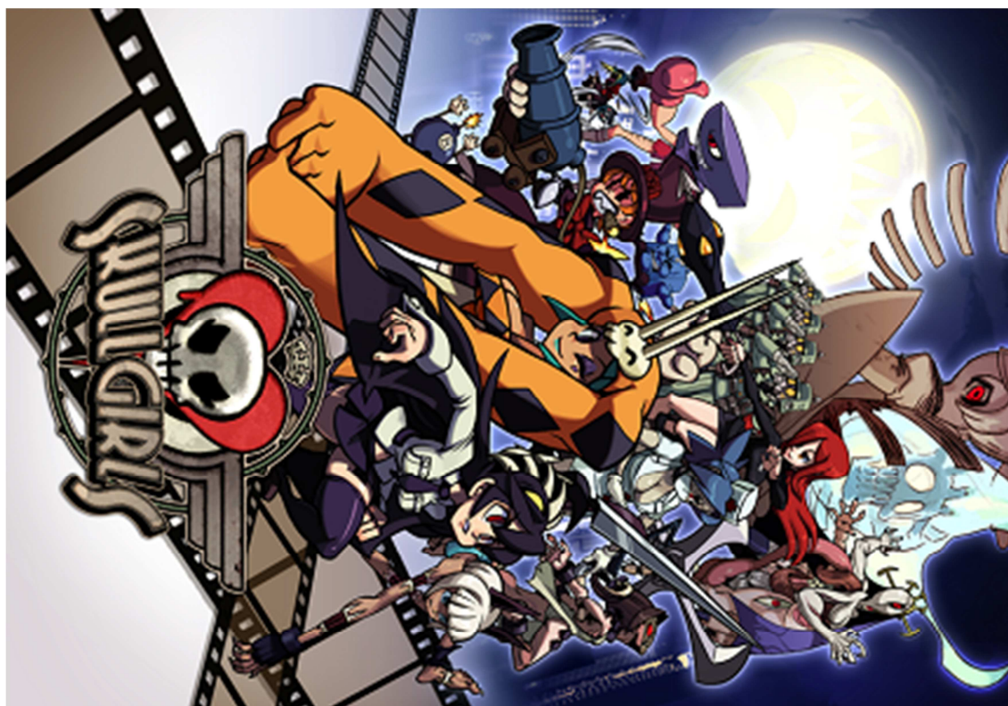
Figura 46- Personagens do game Skullgirls