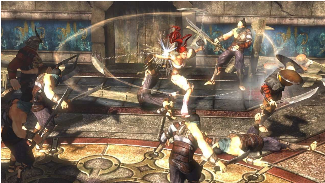
Figura 9- O jogo é marcado por movimentos de combo, de curto e grande alcance.