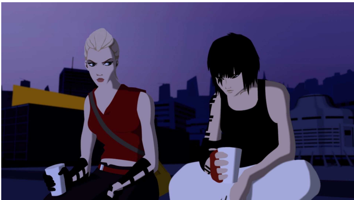
Figura 13- As cutscenes apresentam-se em forma de animação 2D estilo vetor.