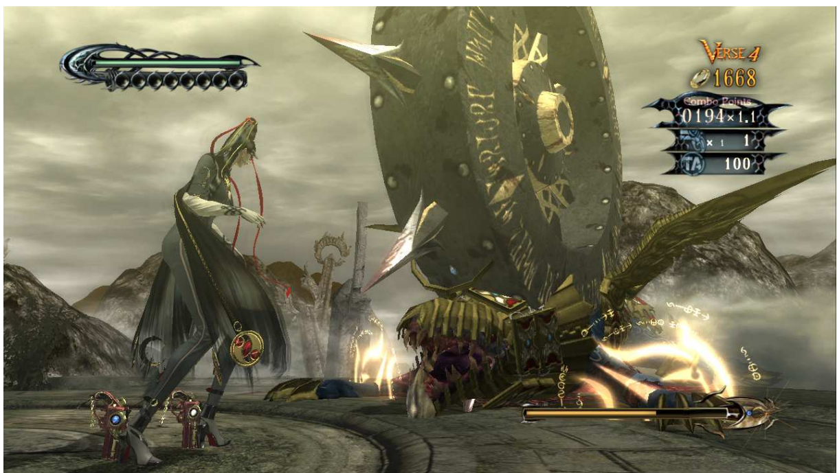
Figura 16- Cena do gameplay de um dos golpes para “mutilar”o inimigo.