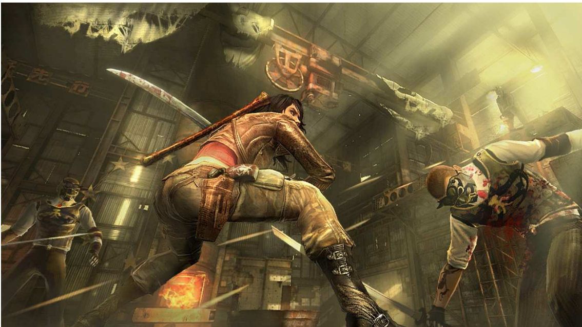
Figura 18- Gameplay utilizando a espada.