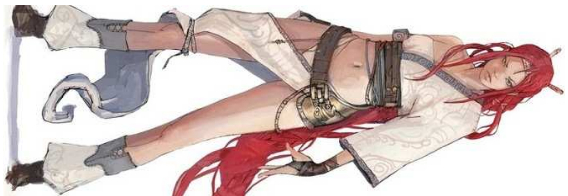
Figura 33- Nariko, do game Heavenly Sword