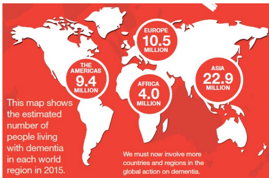
Figura 1 - Incidência de demências por região no mundo