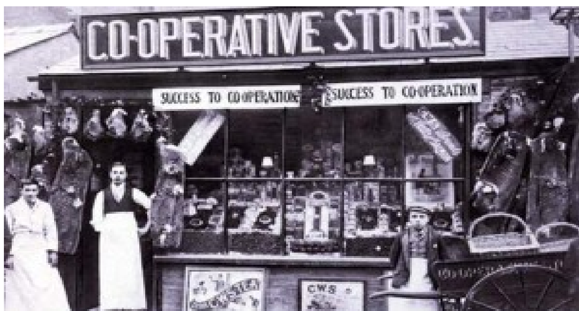
Figura 2 – Armazém de Rochdale

Fonte: Portal Coop. Financeiro (site) 2020