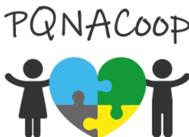
Figura 6 – Logomarca da PQNACOOOP