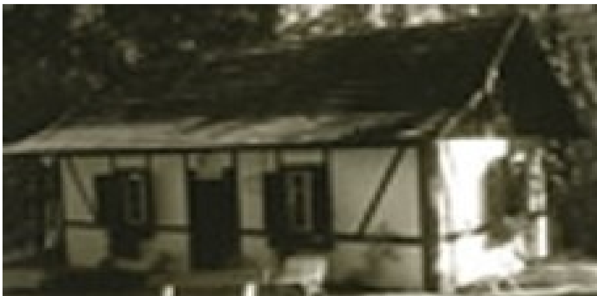
Figura 3 - Cooperativa de Crédito Caixa Rural de Nova Petrópolis, 1902.